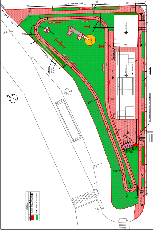
CONSTRUÇÃO ESC.: 1:500